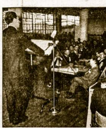
HARRY BRIDGES laivų sandėlių darbininkų unijos prezidentas ir CIO vadnas Pacifico pakrasty raportuoja atsidarius tos unijos konvencėjai Los Angeles mieste, balandžio 7 d.