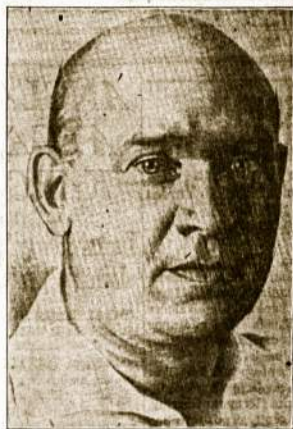
Baldandžio 16 d. Sukanka 55 Metai Amžiaus Vokietijos Komunistų Partijos Generaliniam Sekretoriui ir Darbininkų Klesos Vadui

Aštuoni metai šį pavasarį sukanka kančių ir persekiojimo Ernestui Thaelmannui Vokietijos nazių kalėjimuose. Vokietijos Komunistų Partijos vadą Hitlerio policija uždarė į kalėjimą pavasarį 1933 metais po sudeginimo Reichstago.