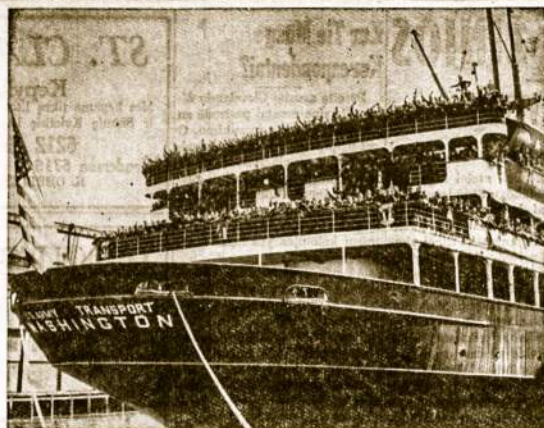
J. V. transporto laivas "Washington" apleidžia New Yorko uostą su 3,000 Amerikos kareiviu. Laivas plauks į Panama, Hawaii salyną, o vėliaus į Filipinus.

Velionis išvažiuo iš Lietuvos dar jaunas būdamas į Skotiją, Glasgow ir ten dirbo anglų kasyklose. Iš ten jis persikėlė į Jungtines Valstijas, į Thomas, W. V., ir dirbo anglų kasyklose. Ten jam darbas nepatiko ir tada persikėlė į Chicago ir dirbo iki 1921 metų. Iš Chicagos atvažiuo į Buckner, Ill., ir vėl dirbo prie anglų kasinio iki 1927 metų. Paskui buvo atleistas iš darbo ir tada persikėlė į Christo-