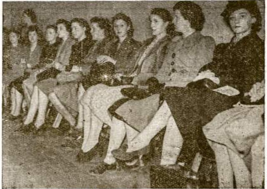
Nejaugi taip bus be pabaigos? Kaip atrodo, iki kapitalistinė sistema visai išgais, karai puskartos kiekvieną gentkartę. Štai burių anglių meringų Londone, kai jos užsiregistroja karinei tarnybai. Visos jos gimusiospo 1918 m., tai yra po „paskutiniojo karo.“

Budriko Nedėlinis Programas WCFL 1000 K., 6:30 P.M. Per Vasarą