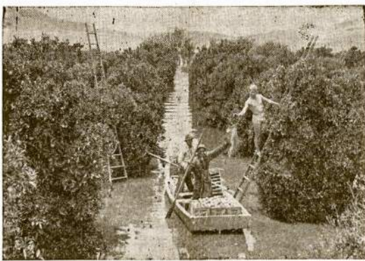
Nepaprasta metoda vaišių skyrimo Californijos oranžų soduose: irdamiesi luoteliuose darbininkai kaip bėmatai priskina pilnus krepšius. Tai įvyko anų dieną kaip po didelio lietaus vanduo persilėjo iš Puddington tvenkinio ir patvindė visą klonį, kuris gausus apelsinų ir citrinų sodams.

Dabar nuo dvylikos iki keturiolikos tukstančių pė-dų aukščio kalnai apjuosta tą žemės plotą. Lyg miži-niškaime, pačios gamtos statyti, murai, nuo dviejų iki pustrė-čios mylios aukštumo į pa-dangas kylanti kalnai sulai-ko vis daugiau ir daugiau drėgmę nuo tos palyginamai lygumos. Taip kad šiandien lietus skaitomas labiau už prajovus nei už pilimtą ir neišvengiamą dalyką. (Tęsa ant 4-to pusl.)