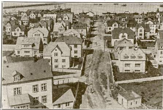
Islandijos sostinė Reykjavik. Miestas guli piet-vakariniame salos krašte, Atlantiko įkišulyje vadinamam Fax Fjord. Čia nau dien atskirautė Jungtinių Valstijų karinis laivynas, kad užbėgti nacių už akių ir nedaleisti jiems okupavus salą įrengti ten piratų bazę.

Islandiečiai turi labai turtingą literatūrą. Jų liaudies dainos ir pasakos surašytos tūkstantis ir daugiau metų atgal užsiliko iki mūsų lai-