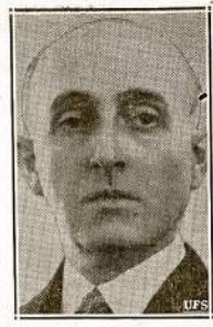
Peru respublikos prezidentas Manuel Prado. Jis aną dieną pareiškė, kad ant tos respublikos pasikėsino Ecuador respublika. Pastarosios valdininkai atsėvė tuom pačiu. Dabar J. V. ir didžiųjų Pietų Amerikos respublikų vyriausybės bando sustaityti ginčus tarpe šių dviejų mažutikų respublikų ir likviduoti incidentą.

Telef. Republic 1538. INTERNATIONAL LIQUOR CO. 6246-48 S. California Chicago, Ill.