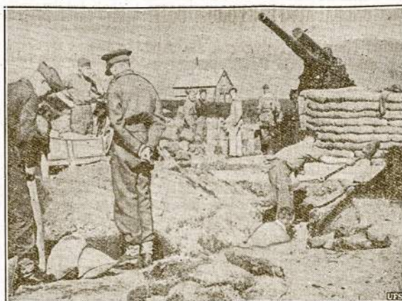
Jungtinių Valstijų marinai įsikuria Islandijoje. Jie ten bus iki pailsaiba dabartinis karas, kad nedaleisti naciams užimti tą svarbią kariniu atžvilgiu salą šiauriniame Atlantike.

MASKVA, liep. 10. — Kaip daugelis ženklų rodo, Tarybų Sąjunga jau bus baigus kariuomenės mobilizaciją. Kiek jos su-mobilizuota, tai karinė paspartis, bet kaip tvirtinama, jos užteks sunaikinti nuožmius Berlyno fašistus.