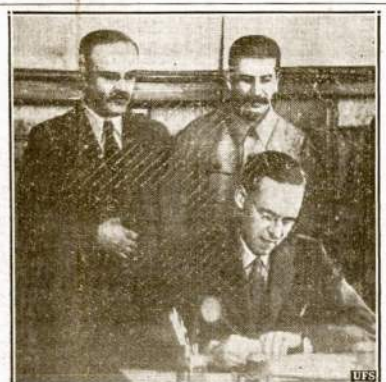
Iš kairės (stovi) V. Molotovas ir J. Stalinas tēmiya kaip Anglijos ambasadorius Stafford Cripps pasirašo talkininkystės sutartį.

Delto kad iš užsienio ministe-rijos pašalintas Yosuke Matsuo-