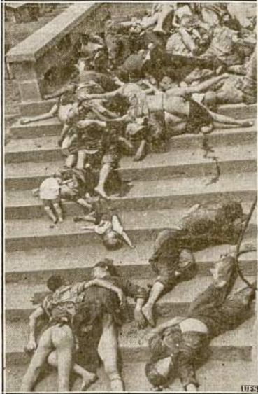
Šiurpas vaizdas bestijisko Japonijos darbo. Kada japonai bombardavo Chungkingą, bombos pataikė į “apsaugos vietas” (air-raid shelter), kur buvo tūkstantai kiniečių pasislėpę apsaugoti savo gyvybę. Šioje tragedijoje žuvo 700 kiniečių. Paveikslas parodo tą baisią tragediją. Nuomžinis karas, kurį sukūrė fašizmas, milijonus žmonių išžudė, sunaikindamas kultūrą, sunaikindamas viską kas puikiau, kas naudinga žmonių gyvenimui.