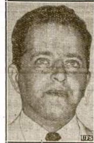
Sovietų Sąjungos ambasadorius Amerikai, Konstantin Umanski. Paveikslas nutrauktas, kada jis aplėdo Baltųjų Namų po pasikabėjimo per 45 min. su prez. Rooseveltu.

...nime privedė prie užsienio prekybos, pramonės, darbo žmonių gerovės katastrofiško smukimo. Ji yra žymiai gilesnė. Greitai rieda žemyn visokio plauko reformistų ir oportunistų įtaka, dingsta tikėjimas garsiąja "socializmo jaugimo į kapitalizmą" teorija.