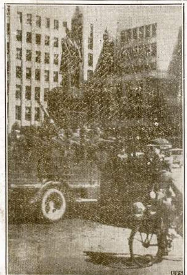
Štai gražusis Minskas. Tarybų Baltarusijos centrinis miestas (sostinė). Šiuo tarpu miestas nazių rankose, bet po valiai prie jų artinasi Raudonoji Armija.