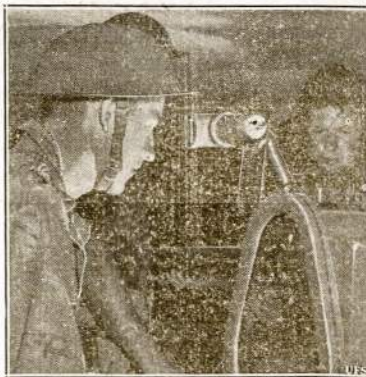
Tai kyklis tik už 50 centų! Sužinojė, kad Tennessee stovyklos kareiviai patys pasigamino laikyklį anti-lankinei kamuolei, kuris telėsavo tik 80.30. Texas stovyklos kareiviai ėmė ir "subytino" juos. Jie pasigamino taip jau gerą laikyklį tik už 30c. Čia jis ir matomas po pirmo išbandymo.