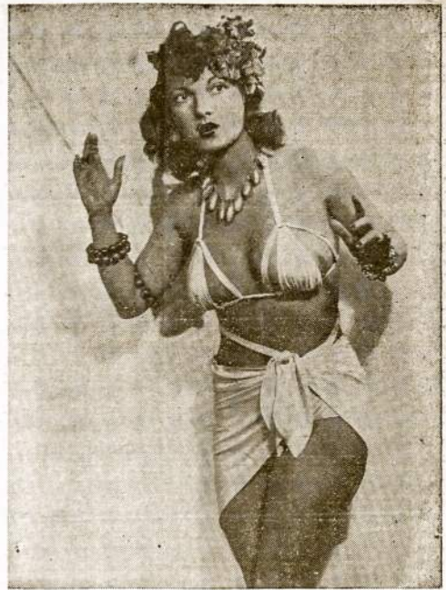
ANN CORIO , celebrated strip-tease artist has done her last strip-tease. She is a member of the legitimate stage now. She appears as Tondeleyo , the native girl, in the play "White Cargo."