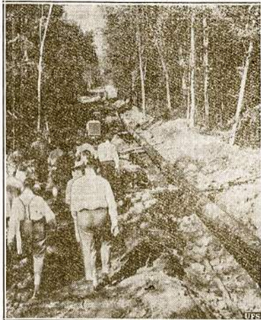
Aliejus Kanadai iš Amerikos. Atvaizdas nutruktas Maine valstijos laukuose, kur darbininkai praveda storus rymas. Tomis rymomis nutrukus pradės leistu po 50-000 statinių aliejiaus į dieną tiesiai į Kanadą. Įtaisymas atsisė $8,000,000.

Kiti šaltiniai šios žinios kol kas negatvirtinę.