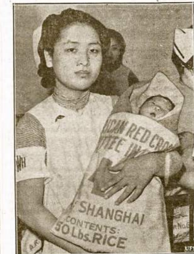
Amerikiečių aukos Kinijai sumuodamos iki paskutiniais sūleliū. Amerikos Raudonasis Kryžius jau senai siunčia maisto ir medikamentų Kinijai. Kaip šis atvaizdas parodo, kiniečiai naudingai suvarvoja net ir tuos maistukus, kuriuos pasučiama ryžiai. Visk, jau penktas metas Kinijai teriojama įsiveržėti japonų ir dėlto mato trūksta, netik maisto, bet drabužių ir kitokių gyvenimui reikalingų reikmenų.

Lengviau pakęsti karščius, jei mažiau valgytume. Pavyzdin, vidurdienio valgiui pakanka vienkaitę obuolį sukrimsti. Nebijokite, dėl to per daug nesuliešėsite.