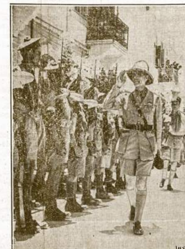
Gen. George Catroux patikrina laisvųjų francijų kareivius kur nors artimuose rytuose. Laisvųjų francijų direktorija pasisakė už bendrą karinį veikimą su Sovietų Sąjunga prieš Hitlerį.

NEW JORKAS.—Trade Board suspendavo visokių silko pirklybą su Japonija.