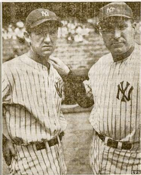
HELPING YANKS—Two reasons why New York Yankees are far in lead of American League. Vernon (Lefty) Gomez, left, and Charley Ruffing, are veteran pitchers whose mound work has boosted effectiveness of team this season. Gomez has been with Yanks since 1931; Ruffing since 1930.

$1,056 DOLLARS WORTH OF PRIZES AT COMING VILNIS PICNIC, AUG. 17