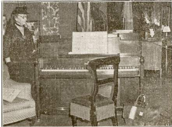
Pianisto Ignac Paderewskio sesuo, Antonia Wilsonska-Paderewska, stovi šalia piano, ant kurio paskutiniu kartu skambino pasauliniai garsus muzikas prieš mirtį. Pianas išstatytas parodai Stainway Hall, New Yorke.

Pittsburghie ir apielinkėj pristatė daug federalių namų. Apšaučiuoja, kad čia yra del 10,000 šeimų pastatyti federaliai namai.