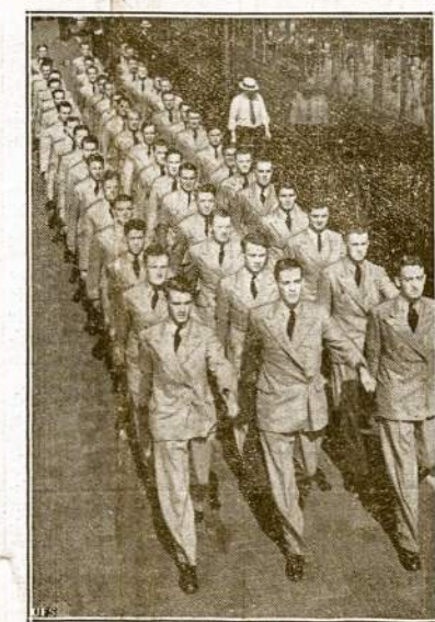
Anglijos lakūnai Californijoje. Tik šiom dienom į Glen- dale, Cal., iš Anglijos atvyko 50 jaunų vyrų pasimokin- ti orlaiviminkystės Amerikoje. Už 20 savaičių jie grys Anglijon jau pilni išlavinti lakūnai ir stos karan prieš nacių gausią Europoje.

Priežastis riaušių buk esanti sąmdymas neuniųjų dirbti.