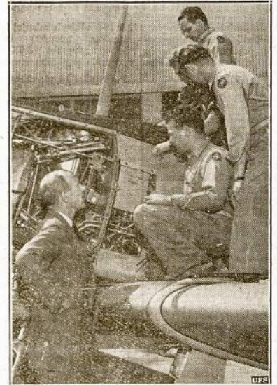
Anglijos ambasadorius Halifax apžiūrinėja mokyklinį lėktuvą Los Angeles imonėje. Šiuos lėktuvus jaunų lakūnų lavinimui būdavoja viena firma Californijoje del Anglijos, Kanados ir mūsų pačių karo departamentui.

Berlynas. — Per šepytins mėnesius šiemet Anglija netekus 1,607 orlaivių, sako nacii daviniai. (Sovietų daviniais Vokietija netekus apie 5,000 orlaivių vien Sovietų fronte)