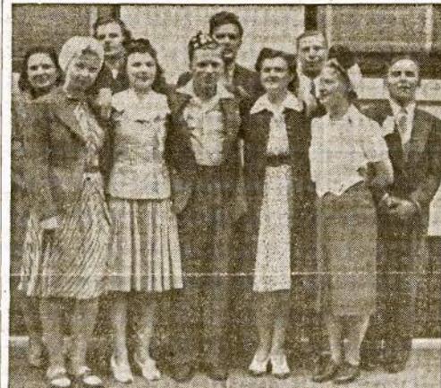
Above is a photo of Lithuanian-American delegates at the recently held American Youth Congress.