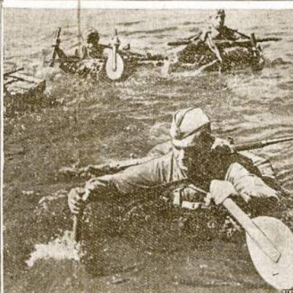
Raudonarmiečiai plaukia per upę. Laiveliai guminiai ir suvynioti telpa į kareivio kuprinę. Tokiu laiveliu kiekvienas raudonarmiečiai aprūpinatas.

Patvarkymas liečia lygiai pileičius, kaip ir sveltžimius. Leidimai bus išduodami valstybės departamento. Taipjuo reikės gauti visas iš valstybės departamento norintiems į Ameriką įvažiuoti.