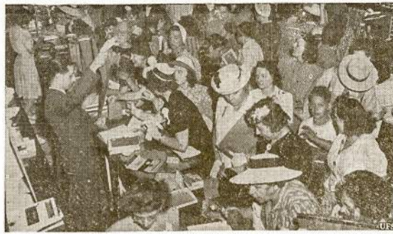
Apsėsimė ir be šilkinčių. Valdžiai paskelbus, jog šilko žaliavos privatės industrijos daugiau nebegaus iki karo pabaigai, didinusių departamentinės krautuvės moterys ir merginos sukėlė beveik "hiltzkrieg", kad prisipirkti šilkinčių panėkėlių. Kas liečia darbininkes, apsiėsimė ir be šilko. Juk ir taip jau šimtai tūkstančių moterų ir mergunų bolikuojo Japonijos šilką per pastaruosius ketverius metus.

Iš Toronto praneša, kad ten poniutės susirupino kojinėms. Girdi, nebus šilko, tai ką mes nesiosim. Nekuriuos pirkosi į dieną net už $200 kojinių. Darbininkės dėl to nesijaudina. Jos nešios medvilnės bet kitų medžiagų kojines ir bus gerai. Per vieng dieną pirkimas kojinių tris kartus padaugėjo.