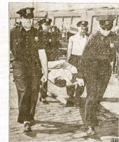
Policija neša vieng 19 aukų užsidegusio Kūbos prekiniu laivo Pambeo Brooklyno priepilaukoj. Viso žuvo apie 19 žmonių tame gaisre.

Lordo Beaverbrooko laikraštis "Evening Standard" parėmė minėtų generolų reikalavimą ir nuo savęs pasiūly "pulti Italiją iš Viduržemio jūros." Tai esą