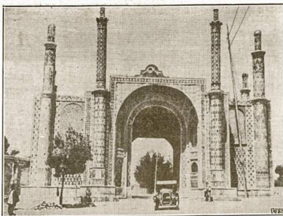
Garsieji Teherano, Persijos (Irane), vartai. Načiai buvo privary savo agentų į Persiją, taipgi Italija koncentravo armiją Trakijoje, o načiai Bulgarijoje, Turkijos pasieny. Tai rodo, kad norima Turkijoje ir Persijoje naujas frontas atidaryti. Bet Sovietų ir Anglijos kariuomenė įėjo Persijon pirma nacų.

Pirmą kartą Latvijos istorijoje dabar pradėta iš lietuvių cheminė kovą su miškų kenkėjais. Buvo paleistos iš lietuvių tam tikros cheminės sudėties dulkės į miškus, užkrėstus pušų šilkverpiu. Iš viso tokiu būdu tuo cheminiu junginiu buvo apdulkinta 4,000 hektarų miško ploto. Šias operacijas atlieka civilinio oro laivyno lėktuvai.