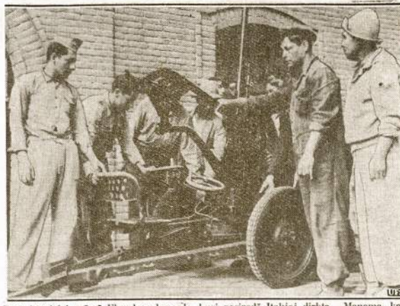
Peru kareiviai suėmė Ekvadoro kanuolę, kuri pasirodė Italijoj dirbta. Manoma, kad Ekvadoras bus remiamas ašies prieš Peru respublikā. Tarp Peru ir Ekvadoro eina susikirtimai dėl teritorijos.