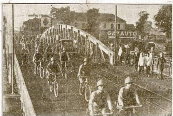
Japonijos kareiviai dviračiais įvažiuoja į Saigon, užimdami Indo-Kiniją, Francūzijos koloniją. Jei maršalo Petaino vyriausybė būtų nepasidavusi, japonai nebūtų galėję taip išdidžiai įvažiuoti. Bet Petaino valdžią yra Hitlerio įrankis, o Hitleris norėdamas Japoniją karan įtraukti pasigerino jai, lepdamas Petainui nesipriešinti japonam Indo-Kinijoje.