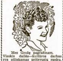
Mes Grože pagražinam. Visokis dailės—sūtitros darbas yra atliekamas prityrustų rankų.