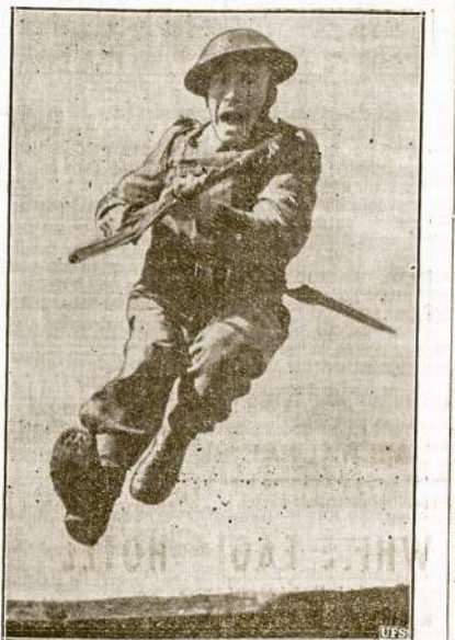
Tommy Atkins rodo ką jis padarytu naciams, jei susidurtų su jais. Paveikslas nūmintas kaip Atkins šoko per tvorą manevruv akcijoj, kur nors pietinėj Anglijos daly. Angliją tur daug tokį Tami, bet nedarant invazijos jie sėdi namie ir laukia, arba manevruoja per tvoras.