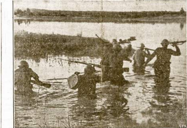
Raudonarmiečiai breną per neįvardytą upę besivydami vokiečius

Naciai juos taip žavi, kad jie visų užmiršo. V. Andrusis.