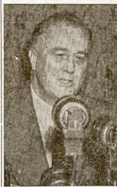
Lithuanian V Conference supports his policy against Hitlerism