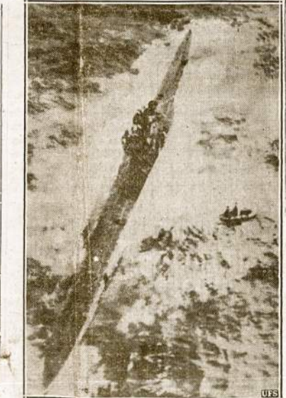
Savaime ar kitaip sugedęs nazių submarinas priverstas iškilti į jūrų paviršių. Angly karai jį suėmė.

Kairo.—Artimuose Rytuose esanti anglų aviacija smarkiai puolė nazius Graikijoje. Ypatiną nuostolingai apdužė Korinto kanalą. Kiti lektuvai skardoni energingai puolė Kretos salos uostą Candlia ir jame esamą nazių karinį aerodromą.