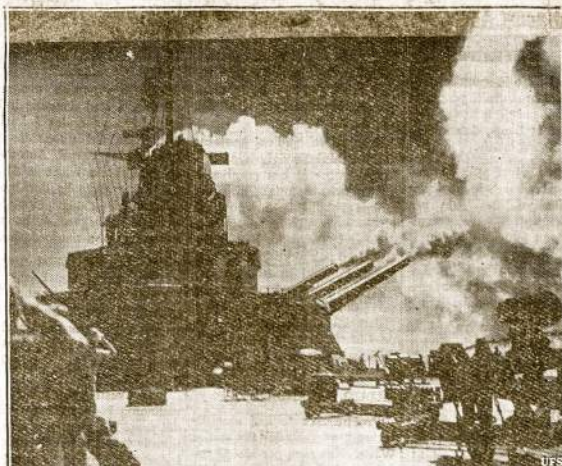
Kaip išrodo Dėdės Samo karo laivas North Carolina, kuris skaitomas plaukiojančia tvrtove, paleidęs kanuoles darban. Tai vienas Amerikos didžiųjų karo laivų.