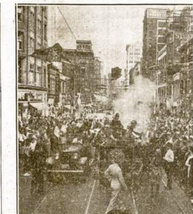
Amerikos Legiono paradas Milwaukee. Legionieriai paleido šūvį iš kanuotės toki dideli, kad langai žvangėjo. Apart "funny" ir parady, legionieriai taipgi svarbė karo klausimą ir pilnai užyrė Prez. Roosevelt užsienio politiką ir Sovietų Sąjungos rėmimą.

Ankara. — Tvirtinama, kad proga Hitlerio ir Mussolinio konferencijos, įvykusios anuo tarpu netoliese rytū fronto, Hitleris griežtai Mussolinio reikalavo gūstį j frontą prieš Sovietus bent du milionū žalių kareivijų.