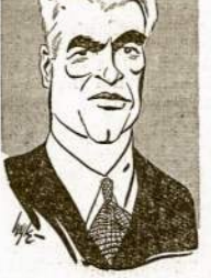
Karikatūra Edward R. Stettinius, kurį Rooseveltas siom dienom paskyrė vyriausiu Lend-Lease įstatymo vyktinju. Prezidentas jam suteikė galia p dokumentais padėti (Roosevelt) parašk, kad nesitrukdytų pasiuntimas apsigynimo priemonių prieš naujus karujančiom valstybėm.