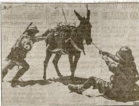
Kaip matyti šiame atvaizde, tai mūli netik farmose vilkdami plūgą "susinarvija." Paveldas trauktas kur nors šiaurinėje Afrikoje, kur Anglija laiko nemažai kariuomenės.

Elgin ir kiti miesteliai, kurie stovi arti Chicago, kas prisitaikyti prie didiniesčio, tai nutarė prailginti dienos šviesos taupymo laiką.