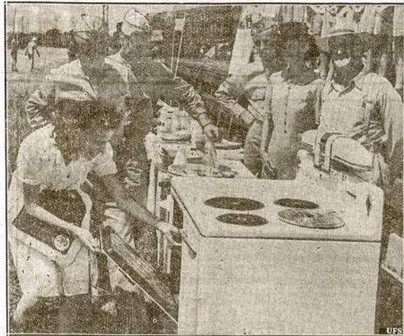
Neprošalį būtų ir misionėrinm pabandyti. Siame atvaizde demonstruojama Floridos agrikultūros departmėto įrengtas traukinys, kuriame mala kvėčius ir ten pat ant vietos kepa duoną ir pyragus. Šviežiai sumalti miltai ir "nesucivilizuoti" yra daug sveikiau. Ši demonstracija atliekama vienoje kariuomenės stovykloje.

Londonas, rugs. 24.—Francuzijos vice-premieras, Hilerio uolius rėmėjas Jėjus Darlas, sako, sekiojus žygius gen. Maxime Weygand, kad gaus ką nors jo apkalintiū. Weygand valdo šalies rėmėjas Afrikoj.