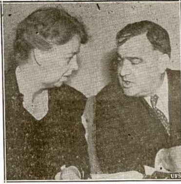
Civilio šalies apsigynimo direktoriai tariasi apie programos pavidimą. Vyriausiu direktorium yra New Yorko majoras LaGuardia. Iš savo pusės pagalbininke jį pasirinko Mrs. Rooseveltienė.