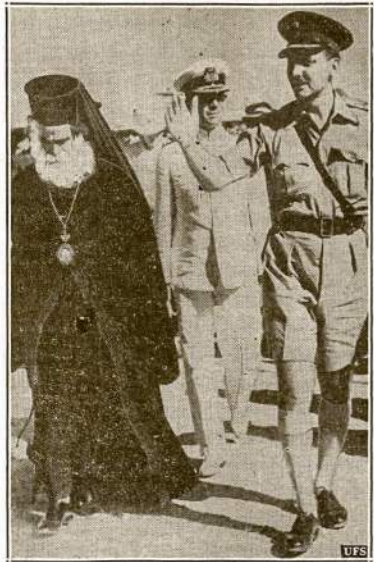
Graikų tauta dar nesunaikinta, nors jų šalis okupuota barbarų fašistų. Vadovaujantys graikai pabėgė į kitas šalis ir iš ten mobilizuoja įsilaisvinimui savo šalies. Kiti namie irgi neduoda naiciams ir italams juodmarškiniams ramybės. Atvažė matosi kunigaikštis Peter ir graikų bažnyčios patriarkas peržvelgiant graikų militarus jėgas Palestinoje.

Madison, Wis.—Iš Washingtono pranešama, jog šiom dienom karo departamentas išdavė sekamus užsakymus Wisconsin valstijos firmom pagaminti apsigynimo priemonių: Kauffman Manufacturing, Manitowoc, už $4,923. Cristal-Federal, Waukesha, už $4,583. Dings Separator, Milwaukee, už $2,850. Yates Machine, Beloit, už $222,870. Kohler komp., Kohler, Wis., už $5,872. Warner Brake, Beloit, už $6,138. Accurate Sales Book, Milwaukee, už $1,400. Allis-Chalmers, Milwaukee, už $30,200. Gisholt Machine, Madison, už 9,750.