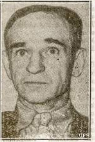
Garsiosios amerikietės aktorios Mae West lietuviškas vyraus...

Viena Amerikos žinių agentija surinko ir paskelbė faktus kaip iš pačios Vokietijos ir načiai okupuotų kraštų kartais žmonės išsiunčia laiškus ir laisvės pasiūlymus su uždraustom informacijom.