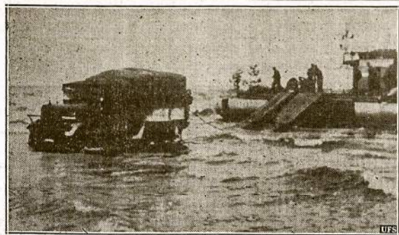
Naciai prisidėję Amerikos spaudai šį atvaizdą paaiškino, jog tai esą viena Suomiių plankos sala, kurią naciai būk paėmė iš rusų. Bet porą savaitių vėliau minima sala dar tebebuvo raudonarmiečių rankose.