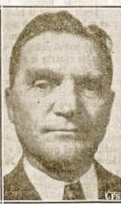
Norėtu užgerinti Hitlerį. Tai vėliausia fotografija senatorius Gerald P. Nye, iš North Dakotos. Jis smarkiai kritikuoja Roosevelto administraciją už griežtą prieš-nacinę užsienio politiką.

Rankinis šios srities elementas nori Bridgeso deportavimo, bet CIO stija prieš jo deportavimą.