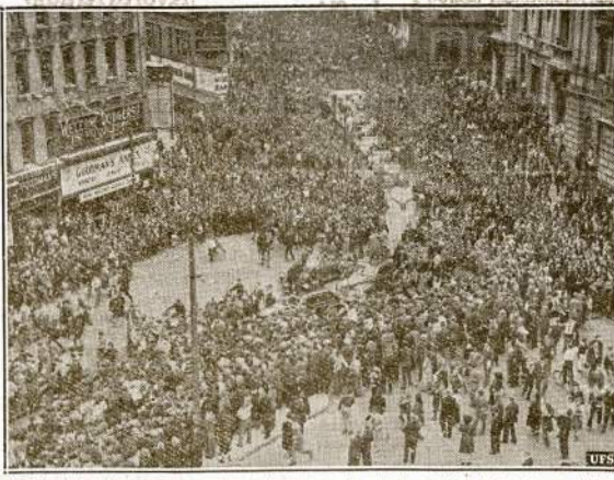
Brooklyniečiai baseholės entuziastai demonstruoja miesto gatvėn kai jų tymas "Dodgers" aną dieną laimėjo rungtynes ir atsisėjo pačioj pirmojoj vietoj. Apskačiuojama, kad demonstracijoj dalyvavo apie trys bertainiai milijono žmonių.

Važiavo kiek automobilius galėjo. Rezultatas: Du žmonės užmušta ant placios Western Ave. McDonald pats sėdi kalėjime. Prieš jį yra keli kaltinimai: Girtas automobilį vairavo; užmušė du žmones; pabėgo nuo nelaimės vietos. Tokių "good times" dažnai esti tolygios pasekmės. Saugokitės to visi.