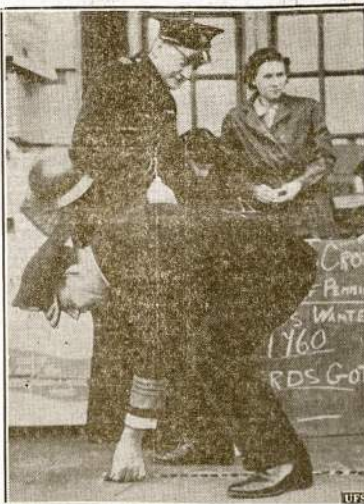
Admirolas Lambeth, Londone, nutiesė vieną mylių centis a, kurie aukojama Raudonajam Kryžiui. Žinoma, admirolui tai nesunku ir geras žašlas. O kada karą prieš hitlerizmą veda Sovietai, tai ir laiko yra žaidimui.