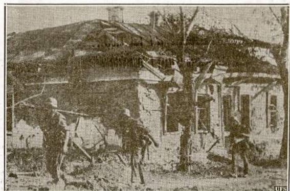
Kaip naciai paduoda savo fronto paveikslus. Jie sako, tai iš Sovietų fronto paveikslas, bet jis gali būti iš bile fronto—vokiečių karo Francūzijoje, Balkanuose ar bile kur, nes nėra jokių požymių, kad tai būtų iš SSSR paveikslas.