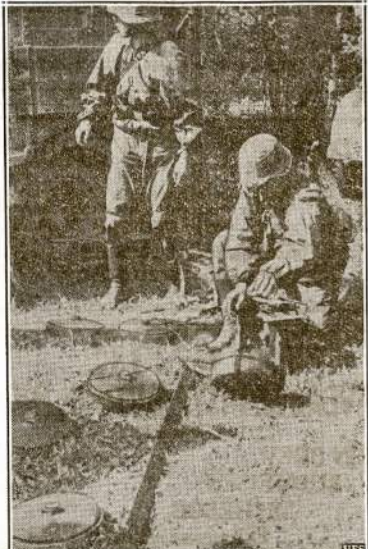
Naciai suradę bombų, kurias pasitraukę Sovietų kareiviai paliko padėlioje, paslėpė daugely vietų. Kai nacijų tankos ar kitos mašinos užėna ant tų bombų, jos eksploduoja sudaužydamos tankas. Po kelių "nemalonių prietikių" naciai paprastai įsėjo tų bombų.