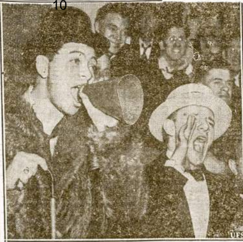
WHO ELSE BUT BROOKLYN?—You're right, they're Brooklyn boys at opening game of World Baseball Series in New York. Rooter at left is well protected from possible chill. Other fellow seems to have been out all night.