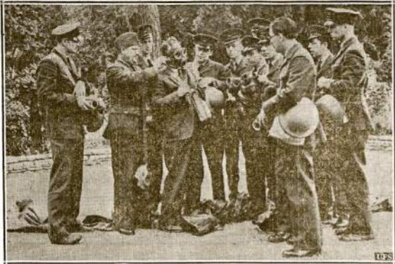
Amerikos liuosnoriai Anglijos civiliams technikos korpusams. Anglijos valdžiai paprasčius ty liuosnorių, daugelis atsiliepė ir stoja į tarnybą. Šie liuosnoriai yra jau Anglijoj.