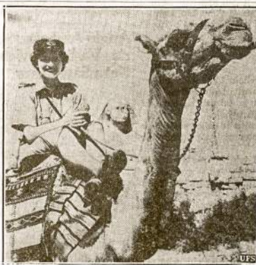
Si angliskė moteriškė turi "fonių" jodinėdama verbiūdiu, Artimose Rytuose, tik ačiu tam, kad naciai dabar kariauja Sovietų fronte; kitaip ji būtų karu lauke. Jinai yra Anglijos avieijos moterų pagalbinės organizacijos narė ir tykus čia su aviacija.

Atminkite, juo daugiau paskleisime "Vilnij" tuo mažiau tiks pro-nacinių spaudai vietos, tuo mažiau ta spauda įtakos turės. O kovoti prieš nacizmą, prieš fašizmą visų yra pati svarbiausia pareiga šiandien.