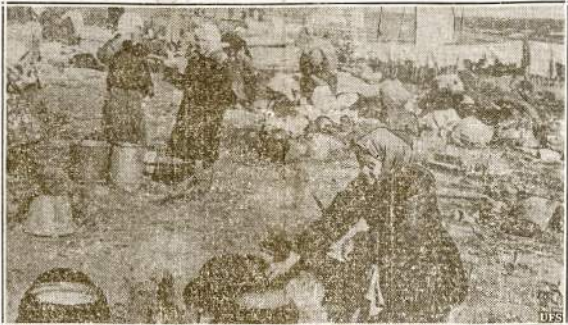
Taip atrodo Jelna miestelis, Smolensko apiešlinkė. Sovietų Sąjungai reikia daugiau sunkių ginklų, kad sutruškint Hitlerinę karo mašiną, kuri jau trečias metas siaubia Europą.

Tatai reikia smerkti, kad išbrukus laukan nacių propagandą. V. Andrusis.