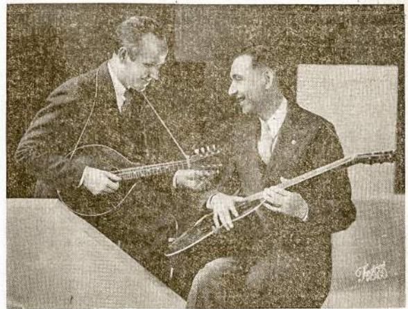
MAC & BOB