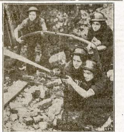
Holloway ligoninės patarnautojas, Londone, liudaus laikui mokinai ugniagesių pareigų—kaip naudoti išduos ryšas, lipioti aukštai laiptais ir tt. Anglijos moters laike šio karo ėmėsi daug visokių darbų, kurie pirmiau buvo skaitomi tik vyrų darbas.

Kas būtų jei visi taip darytų? Subruskite darban.