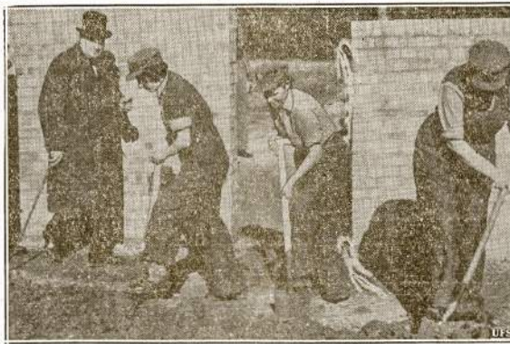
Anglijos premieras Winston Churchill stebi moteris dirbant. Jos yra narės WATS'o moterų pagalbinės organizacijos armijai. Jos kasa duobę įtvirtinimui anti-orlaivinių kanuolių Londone. Merginos ir moters Anglijoj šiuo tarpu daugelyje darbų dirba išvien su vyrais.

Paklauskus kalbos salos čyfas pareiškė: Tai neįmanoma, svečias nori mus išjuokti. Žūrėkite, aš tik laivelį sau iš storo medžio dirbinausi ir tai ėmė ilgiau kaip 6 dienas. Kaip galima visą žemę ir vandenį ir žmones j 6 dienas padaryti.