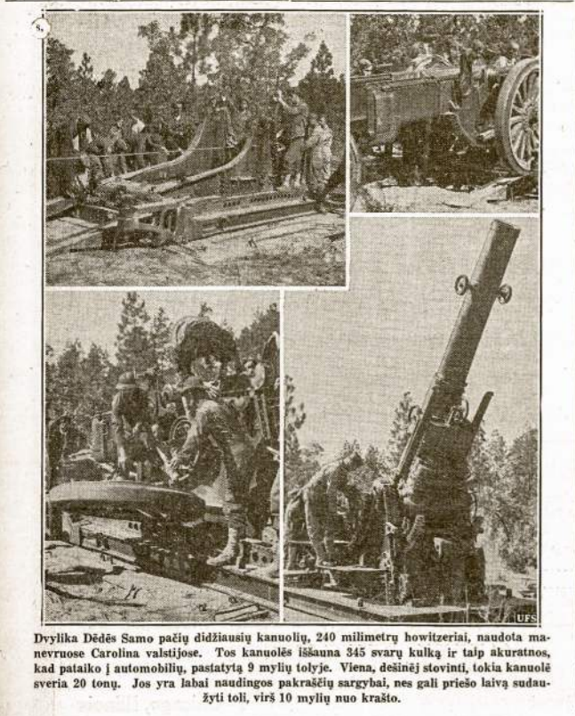
Dvylika Dėdės Samo pačių didžiausių kanuolių, 240 milimetrų howitzeriai, naudota manevruose Carolina valstijose. Tos kanuolės iššauna 345 svary kulką ir taip akuratos, kad pataiko į automobilį, pastatytą 9 mylių tolyje. Vienna, dešinėje stovinti, tokia kanuolė sveria 20 tonų. Jos yra labai naudingos pakraščiu sargybai, nes gali priešoti laivą sudaužyti toli, virš 10 mylių nuo krašto.