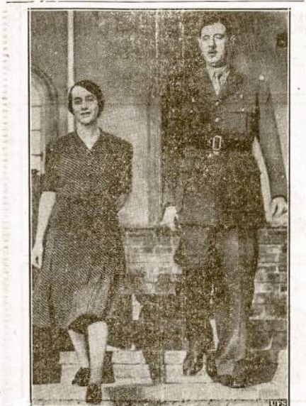
Štai laisvų fracųzų vadas gen. De Gaulle (Dėgol) su žmona. Jie apsigyveno Hertfordshire, Anglijoj.