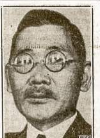
Signori Togo, naujas Japonijos užtenio reikalų ministeris, buvęs ambasadorius Sov. S-joj.

Ištikro, jų elgėsis yra atviras tarkininkavimas Hitleriui ir delto smerktinas. Žurnalistas.