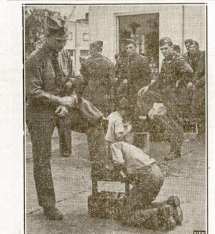
Palaikimas kareivių iš manevrų ir stovyklų savaitės gale duoda apčiai darbo čeverkyj valytojams. Jie net gatvėse savo biznį varo, nes nesutelpama į čamas tam tikslui valykias.