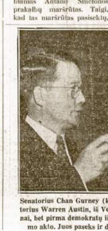
Senatorius Chan Gurney (kairė) iš So. Dakota, ir senatorius Warren Austin, iš Vermont, kurie nors republikonai, bet pirma demokratų išstojo už atšaukimą neutralumo akto. Juos paseks ir daugiau republikonų senate.

"Well, gal jau ne vienas pastebėjo, kad mūsų fašistuojančio spaudoj yra jau skelbiamas Antano Smetonos prakalbo maršrūtas. Tai gi, kad tas maršrūtas pasisektų,