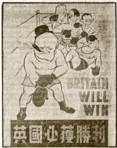
Sumatra salos posteris, kuris charakterizuoja šį karą. Kiniskas parašas sako, tą patį ir angliskas: "BRITANIJA LAIMES". Posteris matomai darytas seniau.