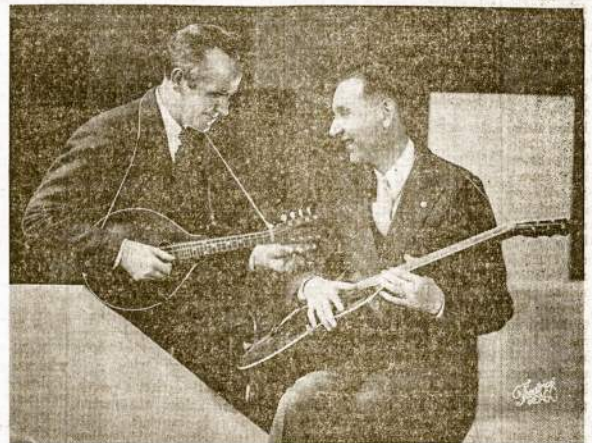
MAC & BOB