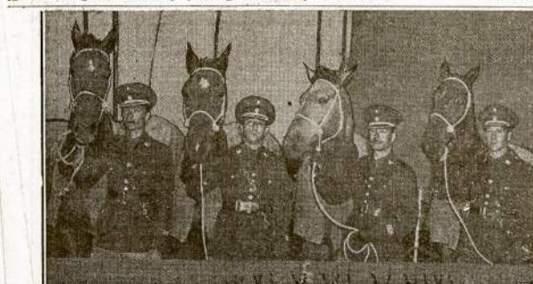
Perų respublikos vizitoriai, Perų armijos jauktas, arklių lenktynių šokinėjant per ankūs užvarus. Peruviečiai atvyko dalyvauti konteste Madison Square Garden, New York, lapkričio 5 iki 12.