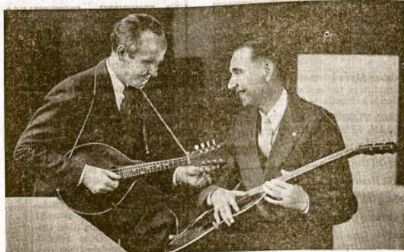
MAC & BOB