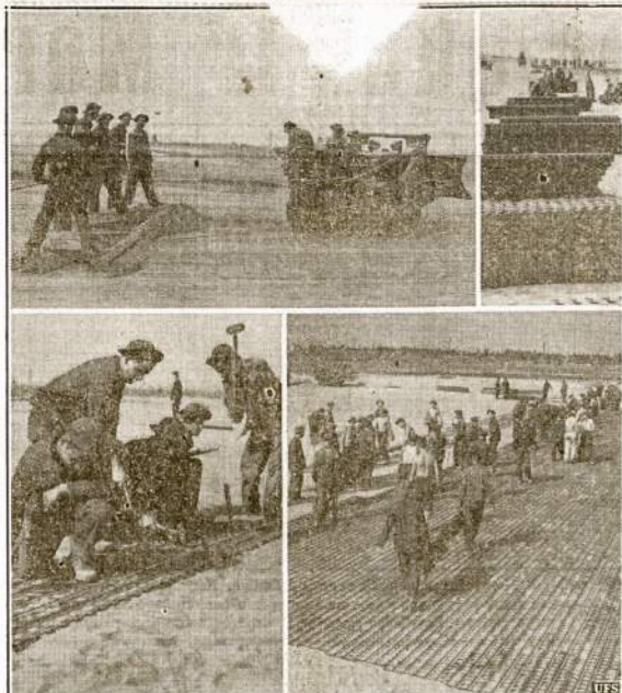
Kilnojamas orlaivias nusileisti bus bene naujas išradimas. Tati naudota Amerikos armijos manevruose Carolina valstijoje. Tokis orlaivias galima nuimti skubiai besiantarint priešui ir patiesti kitur, kur norima nauja bazė įsteigti ir laikinai. Traktorius nutraukia grindis kiton vėlion gan dideliais šmoliais, sykiu nutraukia ir kareivius ant ty grindų stovinčius. Tai gan įdomus ir naudingas išradimas.

Jei pagedatū, kad ir tamsos kaimynas gautų teisingas žinias apie karą, užrašyk jam „Vilni“.