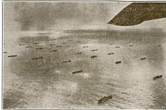
Kaip atrodo laivų konvojus plaukiantis škerai Atlantiką. Kariniai laivai lydi pulką prekinį laivų, kad apgynus juos nuo priešų submarinų ir užpuolų karo laivų. Sis konvojus yra Amerikos laivų. Paveikslas nūimtas iš orlaivio, kuris irgi palydėjo laivus.