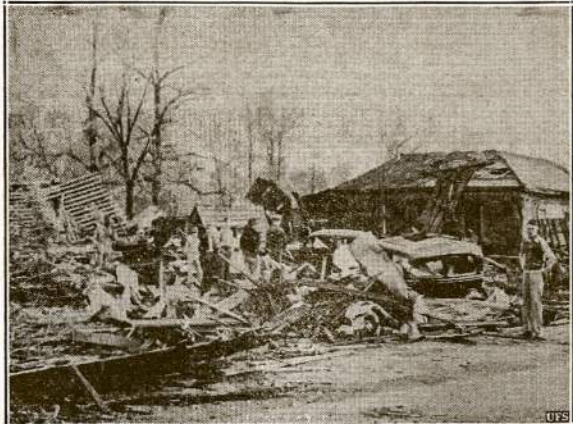
Vėsula sijautė taip smarkiai dalyse Arkansas valstijos, kad kur ji praėjo pasilikto tarsi karo lauko griuvėsiai. Pavėsklas rodo Monticello miestuko griuvėsius. Vėsuoleje 17 žmonių žuvo ir pridaryta didelių nuostolių. Paprastai čia vėsuolos kildavo pavasarį, bet šį sykį ta negeistina viešna aplankė rudenį, kada jos mažiausiai tikėtasi.