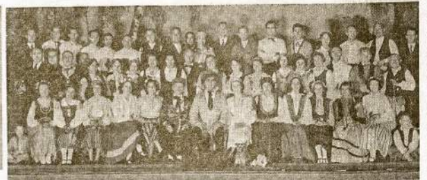
CHICAGO LATVIŲ DARBININKŲ DRAUGIŲ CHORAS

Tuojaus įsigykty įžango tikietus. Iš anksto 85c, prie durų bus $1.10. Bilietus galite gauti "Vilnies" raštinėj ir pas platintojus.