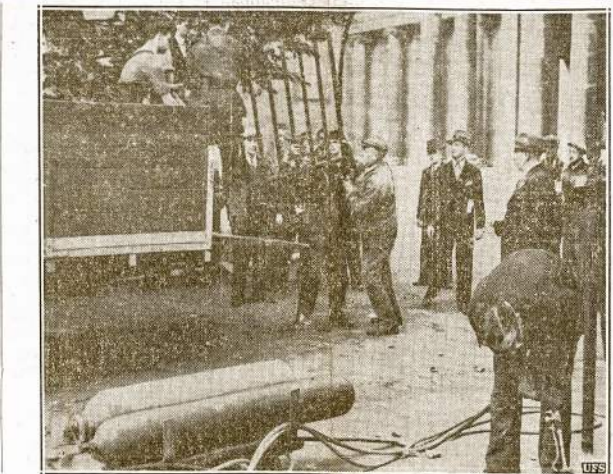
Geležinius vartus, tvoras ir ornamentus anglai deda į trokus ir gabena į liejyklas. Iš sutarpintos geležies paskui gamina kanpoles, tankus ir kitokius pabūklus trisukinti hitlerizmą.