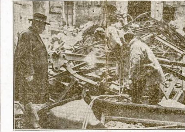
Griuvėsiai Anglijos parlamento rūmų. Juos sudaužė naciai praėitį žiemą.