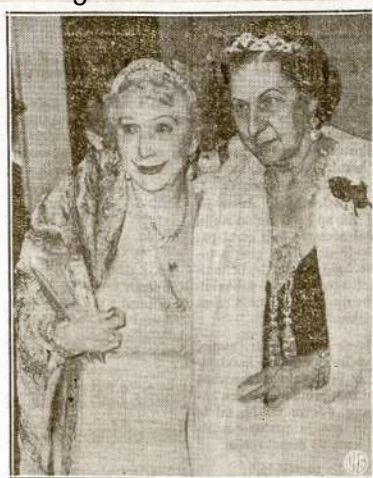
Dvi puošnios ponios laike atsidarymo Metropolitan Operos, New Yorke. Abi jos turi diamato tiaras ir viena jų, leidė Decies, turi diamato ausorius ir poterka. Nežinia, ar jos atėjo paklausti operos, ar pademonstruoti diamantus.

Baigdamas šį trumpą raštą kviečiu visus daugiau veikti pažangos kryptimi. Vietinis.