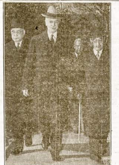
Valstybės Sekretorius Cordell Hull eina į Baltąjį Namą su Japonijos specialiu pasiulu Amerikai Saburo Kurusu, kuris atvykęs čia deryboms. Kitre Japonijos ambasadoris Washingtonoj Kichisaburo Nomura. Japonija yra partneris Mussolinio ir Hitlerio ir jos santikiai su Amerika įtempli.

Jei pageidauji, kad ir tamsios kaimynas gautų teisingas žinias apie karą, užrašyk jam "Vilni."