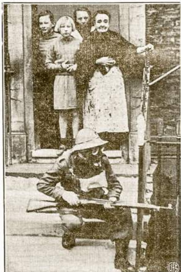
Anglijoj apsigyvinimui sumobilizuota netik karinės jëgos, bet visai civiliai. Šie atvaizdai rodo kaip pratiamam elgtis civiliai Londono apskrityje, jei prie to mes prisirinti naujy gaujos. Visi pilieciai, moterims ir vaikai mokini- nami atlikti tam tikrų pareigy pagelbëjimui karëiviam atmušti įsiveržëlius.

Dabar, kada Hitleris turi už- griebes Lietuvą ir jau davës vardą Ostalandas, kad atëityj mūsų sulaukus užmirštų ir ne- žinot, jog kada tai buvo Lietu- va ir kad 500,000 geriausių mūsų broly ir sesučių buvo su- græsti kalëjimams (o kiek iš- žudë ir kiek išãipë, tik ateisiu parodyti), kada išãipë glajamasi su mūsų brangiais broliais ir se- serim, nori kuodaugybiausiai iš- žudyti, kad į tas vietas padëti hitleriniskais-nacius ir aiðku, kad netik neieis jokias apvietas bei lietuviskai kultūrai gyvuoti ir naikina iki nei zenklo nelieks, mes turime dëli pastangas, kad mūsų kalbã, mūsų kultūrã ne- bëtų nugalëta ir užmiršta. Ar mes duosime tai graðiai kalbai, tų palikimū mūsų bro- lyje; toms maloniosis, links- mosis, laipigi ir mūsų vargas apdauuojançiomis dainoms ir eilëms kur tik? Ne! Mes sklei- sime kur tik galësimë lietuvišką žodį, lietuviskas dainas. Mums tas darbas nesvetimas. Per daugelį mety tvërme cho- rus, rengëme pamokų vakarë- lis, diskusijas, prakalbas, pre- lekcijas; mes skleidëme litera-