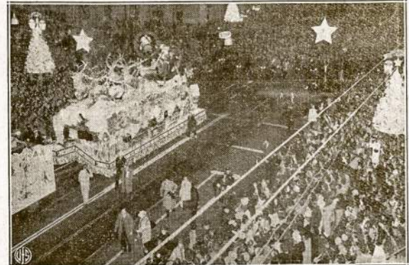
Didysis Hollywoodo Bulvaras, Hollywoode pakeistas į Santa Claus Lane. Ceremonijose dalyvavo judžių aktoriai ir daugelis kitų žmonių. Paradą stebėjo apie milijonas žmonių.