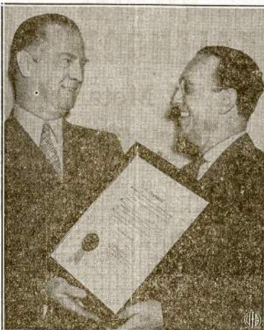
“Tokis tokj pažino,” sako sena žmonių patarlė. Žiūrint į šį atvaizdą ji pilnai pasitvirtina. Štai tūlo “advertaisėrių klubo” viršininkas Philadelphijoje iškia garbės diplomą kolumnistui Pegterui už geriausią “pasizymėjimą” laikraštininkystėj šiais metais. Minimas kolumnistas tuom žymus, kad jis darbo unijų nekencia dar labiau negu šuo graustinio.