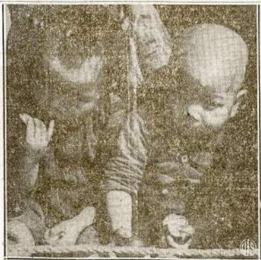
Japonijos barbariškojo imperializmo auka, dviejų metų kietis našlė. Jo tėvis išdraskytas ir tėvai nužudyti išverčėlių. Tūkstančius tokių našlaičių globoja kintiečių draugija iš surinktų Amerikoje aukų.