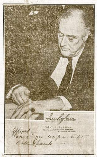
Prez. Rooseveltas pasirašo Japonijai karą paskelbimo dokumentą.

CHICAGOJE IR APIELINKJE —debesuota, šilčiau.