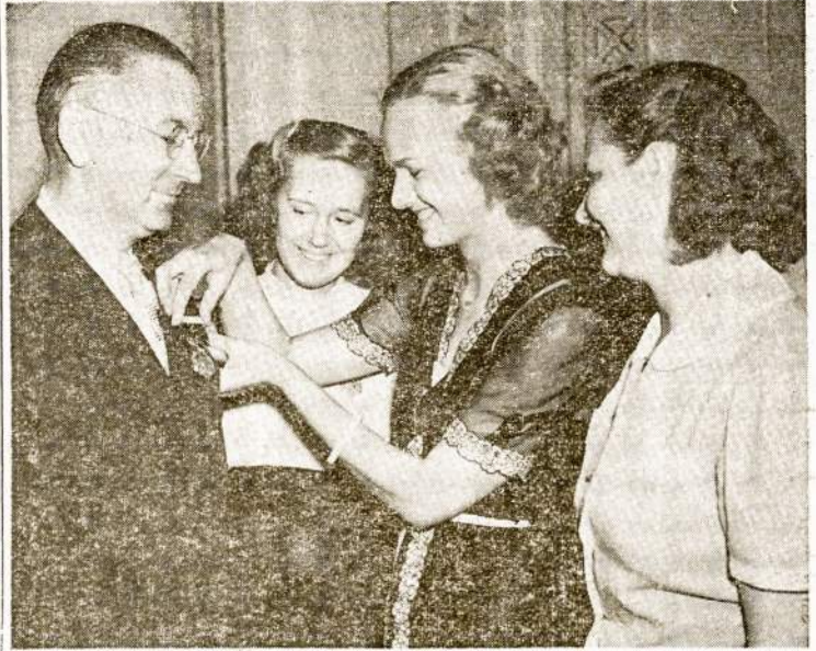
These are LDS girls pinning a delegates badge on a representative from Chicago at a previous convention of that organization. The same procedure will take place at the Chicago '42 convention. Pretty girls are a predominating feature in the LDS.