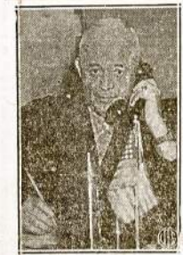
Henry H. Arnold, vyriausias mūsų karinio orlaivyno komandieras. Jis šia matomas priimanč per telefoną raportą orlaivų veiklos kuriam nors karo fronte.

TOKIO. — Agentijos Domei pranešimu, nuo pakeitinto krosnio išsivystė gaisras užsienio reikalų ministerijos rume. Rusmas pusiau sunaikintas.