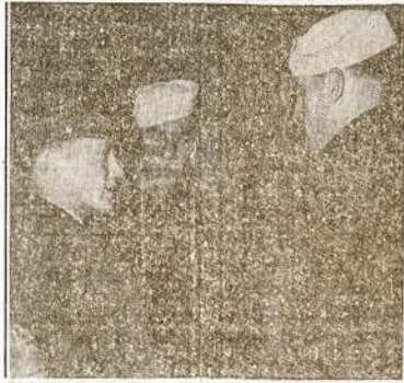
Seimos tragedija kaip paseka hitlerinų barbarų pradėto karo prieš Jungtines Valstijas. Štai žiaginis japonietis, kuris luosnoriai tarasuja J. V. karionenę ir jau pasiekęs leitenanto laipsnį, prašosi įleidžiamas į Ešil Islandą, kad atganyti savo tėvą, kuris areštuotas kaip priešio valstybės pilietis.