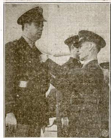
Prezidento sūnus kapitonas Elliot Roosevelt, kairė, priima jam įteikiamą orlaivininkystės navigatoriaus palūdiimą.

Detroit, Mich.—Ford Motor Co. pranešė UAW unijai, kad paragintų į darbą 4,000 narių, kurie buvo iš darbo atleisti.