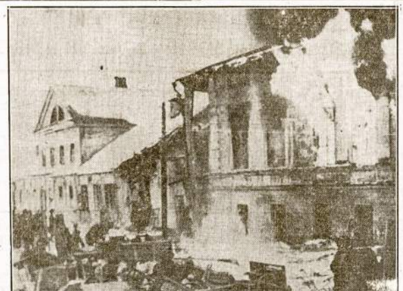
Ar galima stebėtis, kad Sovietų vyriausybė pareiškė, jog sumušus hitlerinę ašį vokiečiai bus priversti atstatyti viską, ką jie sunaikino. Štai Kalinio miestas, iš kur tik ką Raudonoji Armija išvijoj nacių gaujas. Matote liepsniantį budinką dešinėj? Tai pabėgusiųjų barbarų darbas.

VILNIS 3116 S. Halsted Street, Chicago, Ill.