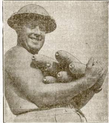
Sugrąžino su "nuošimčiau." Štai australietis kareivis su žienu gėbiva kulky, kurias italai kareiviai bebėgdami Afrikos fronte nespėjo pasiimti. Vėliaus australietis kulkas sugrąžino italams... pasiuntė jas iš kanuolės.

Nelaimė įvyko kai automobi-lius sustojo ant gelžkelio prie Westerboro.