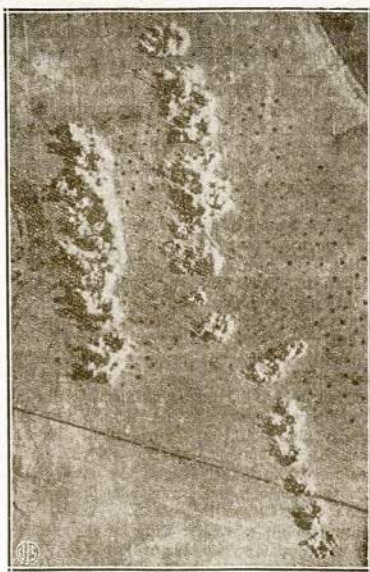
Afrikos tyruose netaip lengva pakavoti karines bazes ir amunicijos sandėlius. Šis atvaizdas nurotauktas iš orlaivio ir parodo vietas, kur orlaiviai turėjo smelbę pasileigę daugybę bombų. Anglų nariai lengvai jas susprogdino pirma, negu načiai galėjo panaudoti jas prieš anglius.