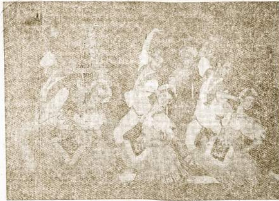
THE PALLETTE BALLET, Šokiai

Durys Atsidarys Nuo 2 Val, Programas Nuo 3:30 Popiet Dvi Orkestros—Ameriko- niški ir Lietuviški Šokiai Nuo 7-tos Val. Vakarø