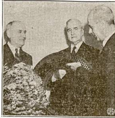
Netruks: Amerikoje pasidarysima gana guma iš vietinių augalų. Šiame atvaizde komercijos sekretorius Jesse Jones demonstruoja pirmą guminį automobilio taserį, pagamintą iš augalo, kuris iškloti tik piktžolė tebuo vadinamas. Dešinėje matosi ir to augalo krūmas. Augalas vadinasi "guayule" ir jo labai daug randasi Texa'je.