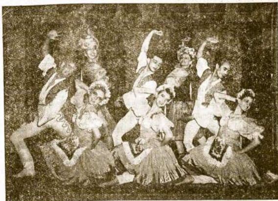
THE PALLETTE BALLET, Šokikai

Durys Atsidarys Nuo 2 Val., Programas Nuo 3:30 Popiet Dvi Orkestros—Ameriko- niški ir Lietuviški Šokiai Nuo 7-tos Val. Vakaro