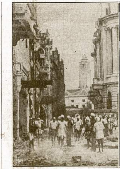
Singaporo miesto dalis. Vietiniai gyventojai, malajiečiai, po japonų lėktuvų bombardavimo nuvalo gatves nuo griuvėsių.

LONDONAS.— Nežiurint kad Anglija neteko Malajose gumo plantacijų, visvien nutarė negaminti sintetinio gumo. Sintetinio gumo gamyba esą ir per brangi ir nesą tiek laivų ta gamybai pargabenti reikiamos žaliavos.