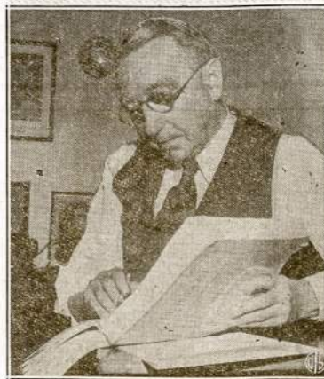
Įsivaizdinkite kiek šis vyras turi galvosukio suba'ansuoti budžetą! Tai senato finansų komisijos pirmininkas senatorius Walter F. George. Nedyvai, kad jis vienmarškinis. Jo budžetas šiems metams turi susibaľsuoti — įplaukos ir išlaidos — virš $59,000,000,000.