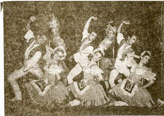
THE PALETTE BALLET, Šokikai

Durys Atsidarys Nuo 2 Val., Programas Nuo 3:30 Popiet Dvi Orkestros—Ameriko- niški ir Lietuviški Šokiai Nuo 7-tos Val. Vakaro