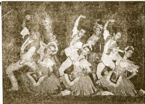
THE PALLETTE BALLET, Šokikai

Durys Atsidarys Nuo 2 Val., Programas Nuo 3:30 Popiet Dvi Orkestros—Ameriko- niški ir Lietuviški Šokiai Nuo 7-tos Val. Vakaro