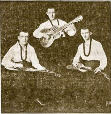
Kenstavičių Gitaristų Trio

Jau buvo kelis sykius rašyta apie gražų ir didelę programą, taipgi galite matyti ir apgarsinime.