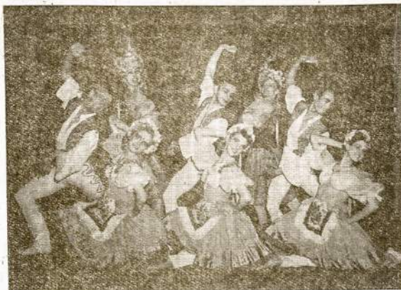
THE PALLETTE BALLET, Šokikai

Durys Atsidarys Nuo 2 Val., Programas Nuo 3:30 Popiet Dvi Orkestrų—Amerikoniški ir Lietuviški Šokiai Nuo 7-tos Val. Vakaro