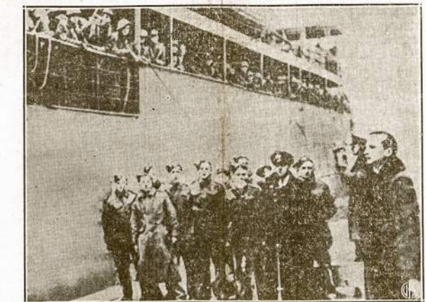
Jungtinių Valstijų transportas šiaurinė Airijos ošte. Jisai atvežė pirmus Amerikos kariuomenės dalinius. Anglijos aviacijos ministeris Sir Archibald Sinclair pasveikino atvykusius.