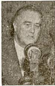
Prezidentas F. D. Roosevelt.