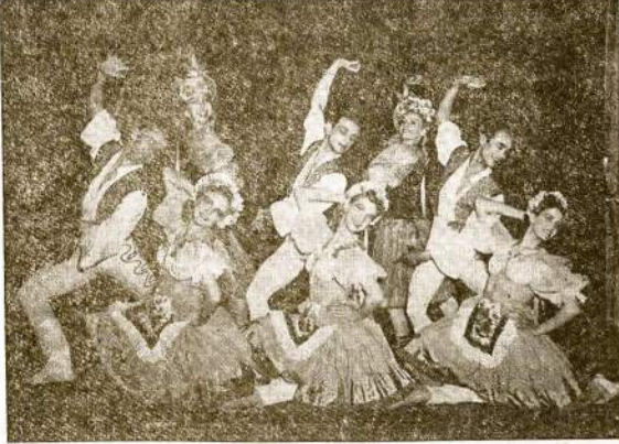
THE PALLETTE BALLET, Šokiai

Durys Atsidarys Nuo 2 Val., Programas Nuo 3:30 Popiet Dvi Orkestras—Amerikoniški ir Lietuviški Šokiai Nuo 7-tos Val. Vakaro