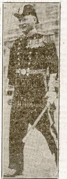
Admirolas Sir John C. Tovey, vyriausias Anglijos jūrinijų jėgų komandieras. Spėjama, kad neuzlogo jis perims komandą ant jūrų visų Suvienyty Tautų jėgų.