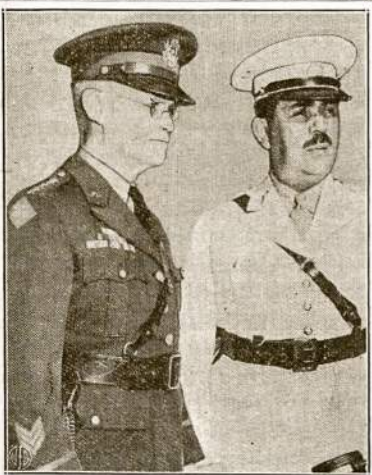
Jiedu tariasi kaip bendrai saugoti dviejų Amerikos respublikų sienas nuo barbariskųjų užpuolikų Pacifiko pakraščiuose. Kairėje stovi Amerikos kariuomenės vakarinųjų pakraščių jėgų vadas leitenantas generolas John L. DeWitt; šalė jo Meksilos generolas Lazaro Cardenas. Paveikslas nutrauktas Agua Caliente, Meksilkoje.

"VILNIS" 3116 S. Halsted Street, Chicago, Ill