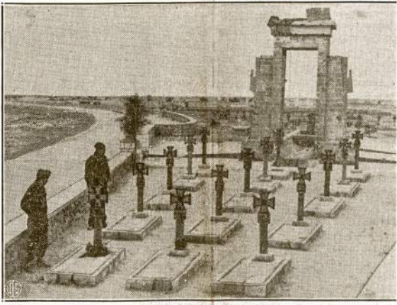
Vokiečių kareivių kapinės Libijos tyruose. Panašių kapinių angliai atranda daug. Tas rodo, vokiečių nuostoliai labai dideli.

Įdomu, kad pirmiau nei širdies liga, nei apopleksija jų neletė. Kas kita karė su Sovietais. V. Andrusis.