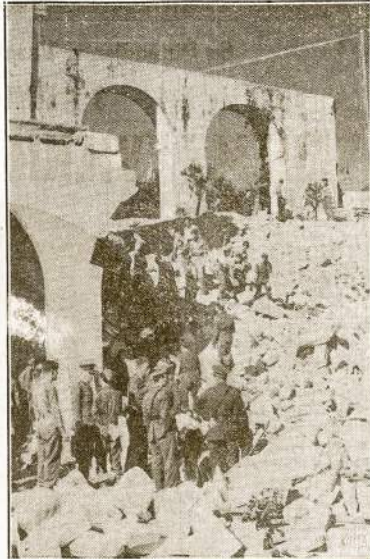
Vaidas Malta sostinės Baletta. Malta yra nedidelė Anglijos sala Viduržemio jūroje. Ten anglai įsitaisę stiprią laivyno ir orlaivų bazę. Naclai ir italai fašistai nuolat bombarduoja Maltą iš orlaivų, kad išvarius iš tos salos anglus jiem būtų lengviau susisiekti iš Europos su Afrikos karo frontu.

Londonas.—Aviacijos ministerio žiniomis, virs Anglijos nukirsta penki vokietieji Dornier 217 bombieriai. Nacių pasakojimu, bombieriai su kroviniu goli iš Vokietijos nuskrityti iki Jungtinių Valstijų.