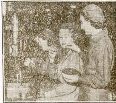
"Tik Sveika Tauta Tegali Gerai Gintis Nuo Užpuoliku." Šis obalis praktikuojamas netik Amerikoje, bet ir kitose prieš fašistus karaujancioje šalyse. Stiai atvaždas fabriko viduje, Anglijoj. Cia daugiausia dirba merginos ir moterys. Kadangi Anglija jau senai kariauja, tai jų trūkumas daugelio dalykų. Kad atpildyti šveižių daržovių ir vaisių trūkumą, vyriausybė duoda darbininkėm po sykį į dieną žuvis alejeaus pily, kuriose randasi daug tų labai reikalingų vitaminių. Vitaminus suaugę merginoms atneša (tesiai) prie mašiu ir virstų.