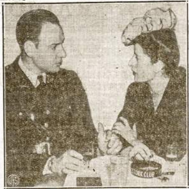
Ir Rockefeller is jsvilkes į J. V. armijos uniformą. Tai aliejuas trusto paveldžiškas Winthrop Rockefeller, kuris netaip seni įstojo kariuomenē ir jau esąs užsielnes paaukštinaim rangoje. Atvaizdas nutrauktas kai jis atostogavo keliom dienom New Yorke.

Sie lakunai bei lakūnės, kurie atsisaikau civiliam patruliuvimui bus vartojami Illinois, Michigan ir Wisconsin valstijose pareigom, saugoti miestus ir aplinkes nuo galimo priešo oro atako.