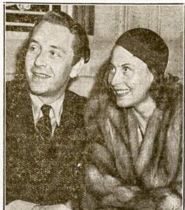
Francūzai dramos artistai, Michele Morgan, dešinė, ir Paul Henreid. Jėdu šiom dienom vaidina New Yorke dramoje "Joan of Paris."

BERLYNAS.—Hitleris informavo laikraštį "Voelkscher Beobachter", kad Sovietų Sąjunga netekusi 8,000,000 karių užmuštis, sužeistais ir į nelaisvę paimtais.