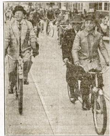
Dviraičiai tuoj bus dar "madingesni," negu nauji automobiliai, kurių dabar nebegamina. Šiame atvaizde matosi dvaratininkų paradas Atlanta, Ga.

Nesišykstėkite tos kainos—budėkime, ginkime laisvę visados!