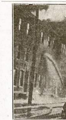
Miliono dolerių nuostolių padaręs gaisras, kuris aną dieną sunaikino veikištis tris kvartalus biznio sekcijos Philadelphiaj. Ugniesgiam gaisrą pagelbėjo gesinti virš 250 liuosnorių vardu, kurie tų pareigų pratinais apsaugai nuo oro atakų.

Metal-darb. P. S. Rašančiam šią žinutę lietuviai darbininkai teko kalbėtis su vienu lietuviu "Naujienu" skaitytoju tuo reikalu. Atrodė, kad visi darbo ir bendrai šalies patriotai turėtų būti už tai, kad karinė produkcija eity pilnu tempu. Bet tas naujienietis užsipulė mane, rekdamas, kad girdi unijos ir komunistai nori viską aukštinuoti kojom apversti, kad darbininkai neturi teisės sakyti bosam kas daryti, kad jei bosai sako, kad negalima, tai negalima, ir taip toliau. Paklausiau jo ar jam delto ne labai svarbu, kad mūs gamyba ir neaugs, nes prisiskaitęs pro-nacinių "Naujienu" propagandos, žmogelis tik sumiškėjo ir nežinojo ką ir sakti.