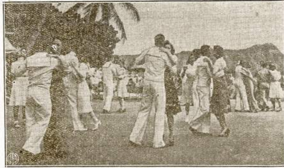
Honolulu, Hawaii. Amerikos kareiviai praleidžia liuoslaikį šiltą pavakarę besėdami Royal Hawaiian Hotel sodne. Viešbutis dabar perimtas valdžios ir jame apgyvendinti mūsų kareiviai. Pirmiau turtingi turistai apsigyvendami jame mokėdavo po $18 į dieną už kambarį.