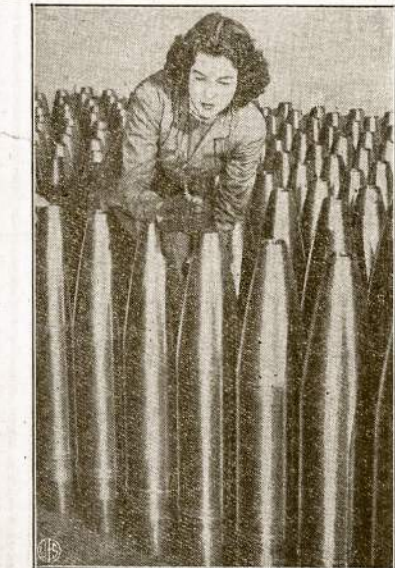
Kanadietė mergina amunicijos fabrike, kur pirmiau tedirbo tik vyrai. Vyrai šandien karo lauke ir jiems būtinai reikalinga daugybė ginklų ir amunicijos. Dėlto moterys užima vis daugiau ir daugiau "vyriškų" darbų.

Atrodo, kad nevien nepasitenkinama savo karine vadovybe reikišias Anglijoje. Kyla tikras judėjimas prieš visų ginkluotų jėgų, ypač orlaivyno vadovybę. Orlaivyno vadovybė daug sykių yra pasakiusi, kad RAF gali apsiėiti be neriančių lėktuvų (dive bombers). Dabar, kada vokiečių karo laivai sugebėjo pasprukti iš po pat Britanijos orlaivyno ir laivyno panosės, pažymima, kad turint didesnę skaičių neriančių lėktuvų gal ir būtų buvę galima dalį vokiečių laivų sunaikinti. Ta proga atmintime, kad Anglijos aviacijos ministeris yra tas pats čemberleinietas, kuris tūlą laiką atgal buvo pasakęs, kad jam nesvarbu ar naciai sumuš SSSR. Tuo laiku tas buvo sukėles didžiausią protesto bangą Anglijoje. Išvadas patys padarykite.