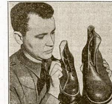
Dėdė Samas savo čeverky "krautuvėje" turi turėti 128 skirtingas mieras čeverky, kad pritaikyti visokią dydžio kojom. Štai armijos "krautuvinėkas" laiko du čeverky rankose, vienas jų "size" 4, o antrasis 15-EE.

Šio mitingo rengėjai, LLD 52 kp. ir LDS 21 kp., užkvičia visus ir kiekvieną sekmadienį, vasario 22 d.