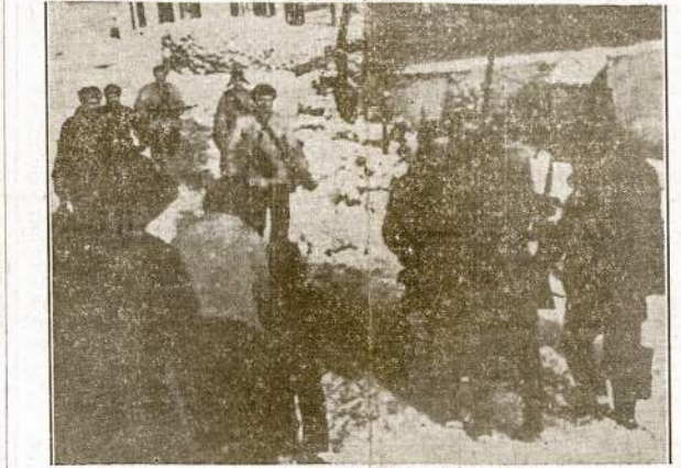
Būrys Sovietų partizanų, kuriuos nuširdžiai sveikina išlaisvintų kaimų gyventojai. Partizanai išlaisvino 40 kaimų.