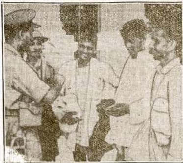
Trys indusi kareiviai, kurie atkirsti nuo savo pulko Malajų pusiasalyje du mėnesiu slapstėsi raistuose. Jie pėkšti perkeliavo virš 200 mylių ir pasekmingai pasiekė savikiškus nors labai privargę, bet linksmūs, kad nepakliuvo į rabininkius ir nagus.