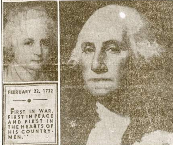
George Washingtonas, kurio gimtadienį minėsime rytoj, istorijoje minimas netiek jau dėlto, kad jis buvo pirmuoju Jungtinių Valstijų prezidentu, bet kad pasekmingai vadovavo kolonijų revoliucijai. Jis gimė vasario 22, 1732 m., Westmoreland apskrityje, Virginia valstijoje. Viršuje matome George Washingtono namus Mount Vernon, kuriuos jis paveldėjo mirus broliui Lawrence. Kairėje—citata paskutinio paragrafo rezoliucijos, kurią kongresas priėmė mirus pirmajam Respublikos prezidentui 1799-tais metais.

ropą ligi pat pagrindu. Daug amerikiečių reikalavo, kad Amerika remtų Francuz. revoliucionierius atsisieiant už Francuz. pagelbą, nepaisant Amerikos neturtingumo. Washingtonas, nors simpatizavo, stovėjo prieš įsikisimą. Politiškai, irgi, šalis buvo pasidalinus. Viena teorija, Alexanderio Hamiltono, norėjo stiprios centralinės valdžios, draugingos agrikulūrai, bet remiančios industrijos išsivystymą. Kita partija, Thomaso Jeffersono vadovaujama, ieškojo liuosai sumegstos federuotos sąjungos, kurioje kiek-