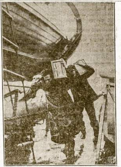
Prekybinio laivyno darbininkams šiom laiku reikia netik prieš užpolimui saugotis ir užpultiems gintis, bet juos dar nuolat kamuoja jūrų audros, ypatinai žiemos laike šiauriniame Atlantike. Šis atvaizdas nutrauktas ant vieno Kanados prekinio laivo kurnors šiauriniame Atlantike. M atome jūreivius perkraustant dėžes tavturų, kada jų laivą audra pusėtinai apgadino.

Pijūšas, būdamas ant Halsted st. viską žino. Jis neapykanta senai protą pralenkė ir visoki padorum užmiršo. F. A.