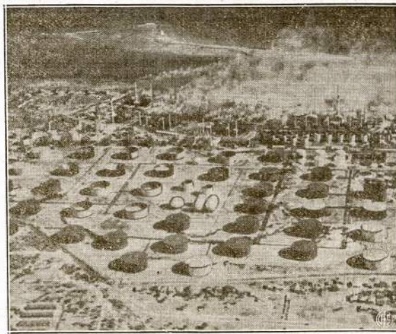
Į šiuos aliejaus sandėlius Araba saloje, Vakarų Indijose, aną dieną naciai taikė, kada jų submarinai paskandino toj apilinkėj kelis Amerikos laivus. Aliejaus sandėliai apsaugoti.

Rodydama pavyzdį kitoms mūsų organizacijoms mūsų draugijos kuopa tuojau turi susinteresuoti tuo klausimu, susitarti su kitų mūsų organizacijų nariais, ir jei galima susaukti konferenciją visų veiklių mūsų veikėjų, kad laiku susitarti, kaip "Vilnies" bazarui kuo geriausiai padėti. Kenosha turi parodyti, kad ji tikrai gali didelių uždavinių atlikti. LLD-ietis.