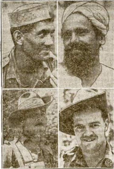
Šitie vyrai gynė Singapora iki pat paskutinės valandos. Viršuje, kairėje, indusos, o šale jo sikh'as, taip jau iš Indijos. Apačioje, kairėje, malajietis, o dešinėje Australijos pilietis. Singapore jau japonų rankose, tikėsimė, tik laikinai.

BERLYNAS.—Patį nacių spauda pasigyrė, kad praeitį savaitę nauji budčiai Holandijai nužudė keturis tos pavergtos šalies gyventojus. Du jų nužudė už žvalginėjimų ir kitus du už palankų atsinešimą linkui nacių priešų.