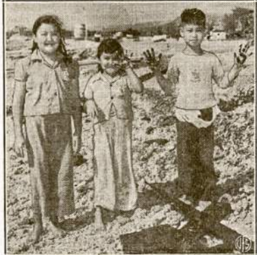
Mūsų vyriausybė, vaduojantis militariniais su- metimais, neskelbia kada ir kur paskandinama ašies laivai ar submarinai. Bet šie hawaiičiai bevaikšiodami pajūryje dažnai pastebi į krantą išplautas japonų submarinų dalis.