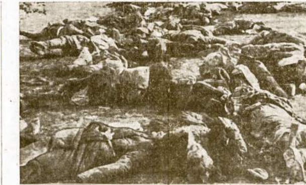
Stai kokias scenas Sovietai rado Rostove, kai Raudonoji Armija tą miestą atkariavo. Visur buvo rasta krūvos lavonų civilių žmonių. Juos nužudė besitraukę naciai.