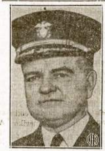
Vice - admirolas William F. Halsey, komandierius mūsų karinio laivyno flotilos, kuri- taip pasekmingai suplekė japonus aų dieną Marshall ir Gilbert salose, Pacific.

Diktatorius, pajėgias vis- ką triuškinuti, neužsiima to- kiais mulkinimais. Hitleris neužsiėmė tuom, kol jam se- kėsi triuškinuti dvyliką valsty- bių. Rusijoje atkando dan- tis ir tada pasidarė katali- ku, paskui musulmonu, o da- bar, vasario mėnesį, pasida- rė musulmonu-kataliku,—visai kaip tas švaksas "Two- in One"! Iš to aišku, kad fa- šizmui matosi galas.